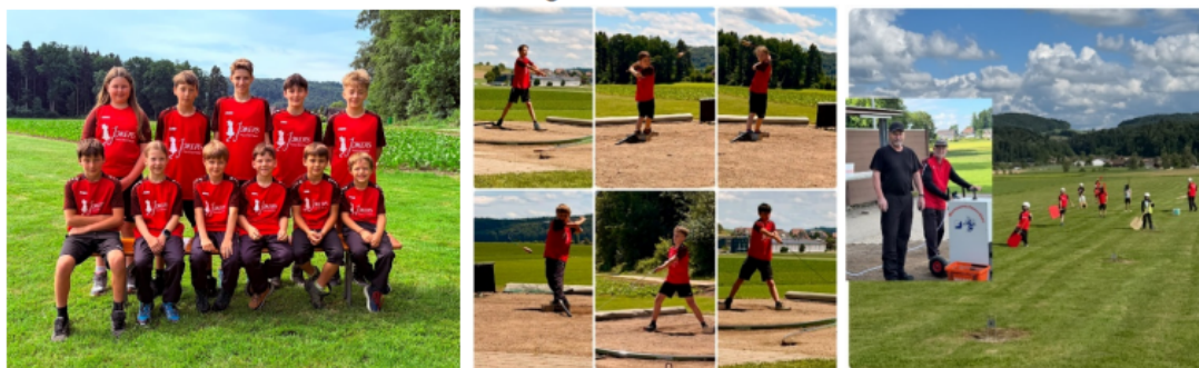
Abbildung 1: Nachwuchs Hornusser Bollodingen-Bettenhausen; mir heis guet zäme u es fägt!